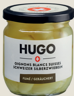
Schweizer Silberzwiebeln Raucharoma